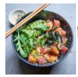
Idée recette Poke Bowl